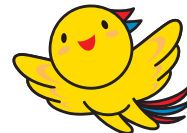
兵庫県マスコットはぼタン

兵庫県内で正社員として働きたい方を対象に 兵庫県内で正社員採用をしている企業とのマッチングを促進するプログラムです。 経験者を求める求人から未経験で応募できる求人等、様々な業種・職種の求人と出会うチャンスです。 新たな仕事にチャレンジしたい方の参加をお待ちしております。