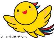
兵庫県マスコットはばタン

兵庫県内で正社員採用をしている企業とのマッチングを促進するプログラムです。 経験者を求める求人から未経験で応募できる求人等、様々な業種・職種の求人と出会うチャンスです。 新たな仕事にチャレンジしたい方の参加をお待ちしております。